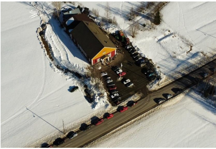
Nysä ilmasta käsin. Ahdasta oli.