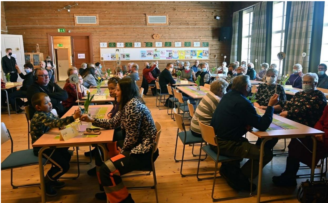
Juhlayleisön Suinula-tietoja mitattiin tietokilpailulla.

Julkinen huomionosoitus on kiva juttu. Täältä pikkukylältä sanomalehtien palstoille pääseminen vaatii aina melkoisen suorituksen, mutta nyt niin kävi, sillä vuoden kylä-tittelin saavuttaminen on melkoinen suoritus!