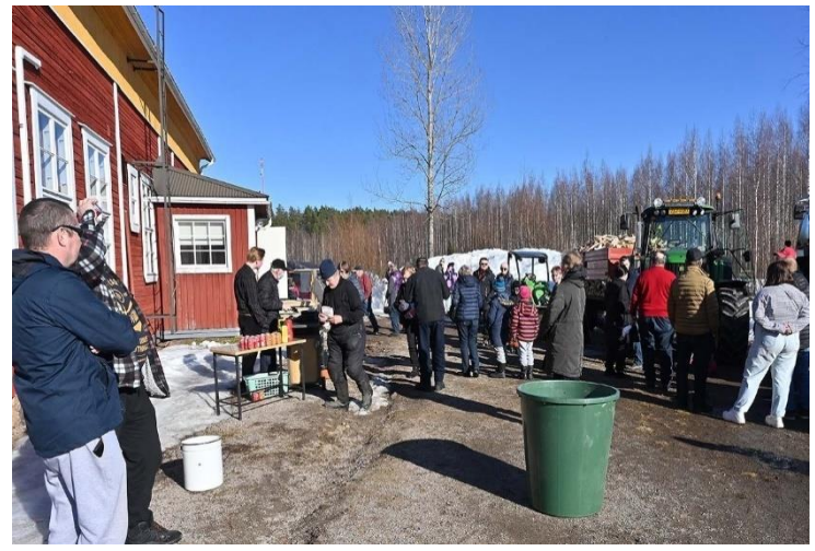
Aurinkoista tunnelmaa pihalla.