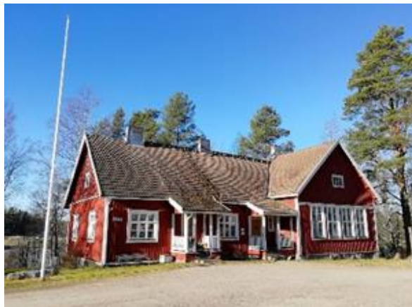
Kylätalo helmikuussa 2020

https://www.facebook.com/SuinulanKylayhdistysKy